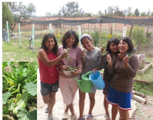
Het regenseizoen heeft op de tuin van het tehuis "Casa de la Alegria" zeker zijn vruchten afgeworpen.