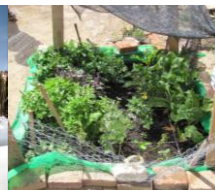
Een van de vele square foot gardens in Las Lomas.