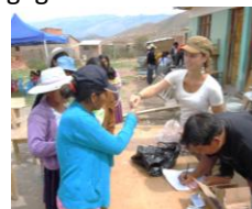
Tijdens de evaluatie werden zaadjes en een handgereedschap uitgedeeld.

Al met al heb ik een hele leuke tijd gehad die voorbij is gevlogen en heb ik veel geleerd tijdens mijn stage. Ik ben erg dankbaar voor de kans die NME Mundial me heeft gegeven!