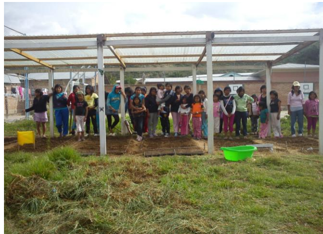
Ons projectteam in Bolivia heeft op verzoek van een organisatie uit Santa Cruz het tehuis Maria Auxiliadora geholpen bij het inzaaien van de tuin.

Naast het voorlichtingsmateriaal heb ik ook een database ontwikkeld. In deze database is te vinden wat de beste producten zijn om te verbouwen in de square foot gardens om de voedingsdeficiënties tegen te gaan. Een aantal goede producten om te verbouwen zijn rode tuinmelde, wortel, spinazie en broccoli. Ik heb hierbij ook een aantal adviezen opgesteld, waar NME Mundial in de toekomst mee aan de slag kan in de tuintjes.