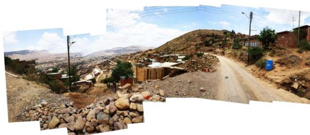
Fotocollage Plan700: Procasha