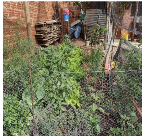
Rechts op de foto de vierkantemetertuin, daarnaast een stuk in de volle grond en op de voorgrond een paar autobanden.

aanleggen. Anderen hebben weinig ruimte rond het huis of wonen op een stukje grond met veel hoogteverschil, waardoor er weinig horizontale ruimte is. Over het algemeen breiden de deelnemers hun vierkante metertuinen uit met een extra of langere vierkantemetertuin, hebben ze ruimte in de volle grond, of installeren ze allerlei soorten gerecyclede plantenbakken.