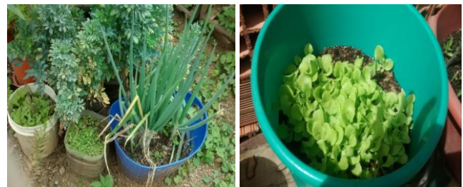
Ook worden de plantenbakken gebruikt als zaailingbakken om plantjes in voor te zaaien.

Allerlei soorten bakken en opengeknippte flessen geven samen extra ruimte om de tuin ook uit te breiden op het cement. Met een beetje creativiteit kan er zo heel wat verbouwd worden in de ruimte rond het huis, zeker als water even geen beperkende factor meer is.